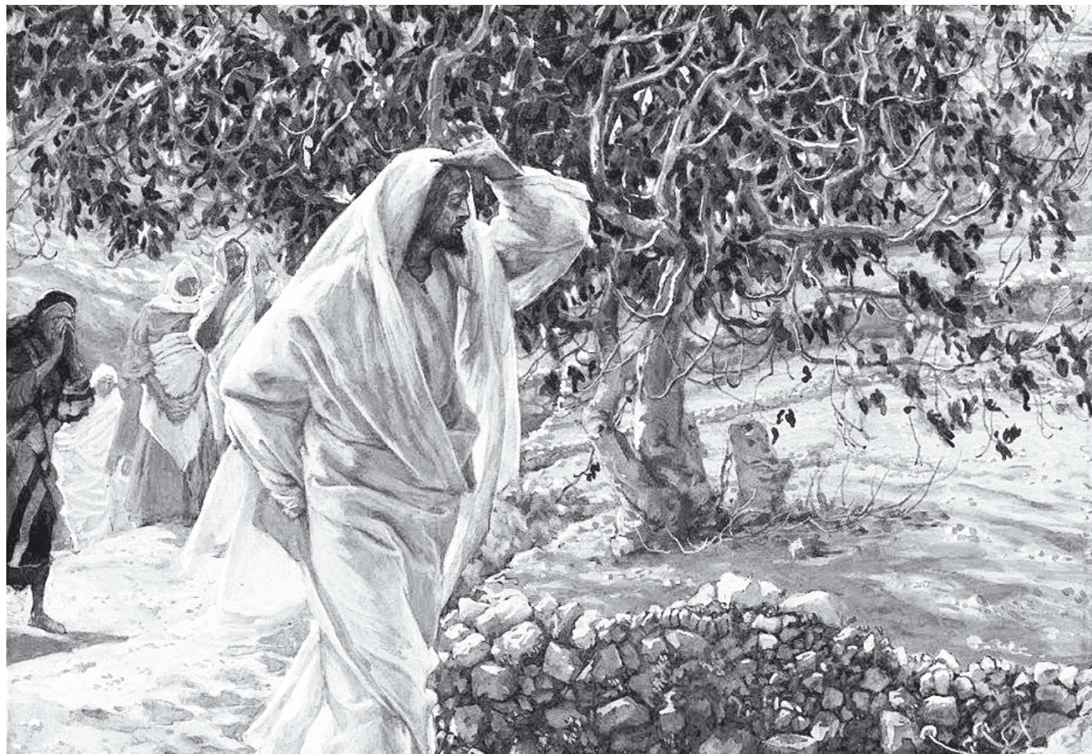
«Проклятие смоковницы». Джеймс Тиссо.

Эта евангельская история учит наглядно тому, как важно всегда учитывать контекст, в котором звучат те или иные слова Священного Писания. Христос недаром был для апо-