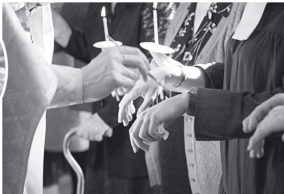
Помазание разных частей тела священник совершает семикратно.

Мы не должны забывать о том, что участие в таинствах должно предвостановляться покаянием. Этот принцип зиждется на евангельском призыве: «Покайтесь, ибо приблизилось Царство Небесное» (Мф. 3: 2; 4: 17).