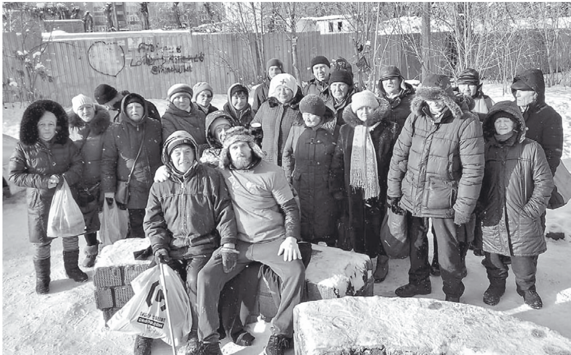
Общее фото во время выездного кормления.