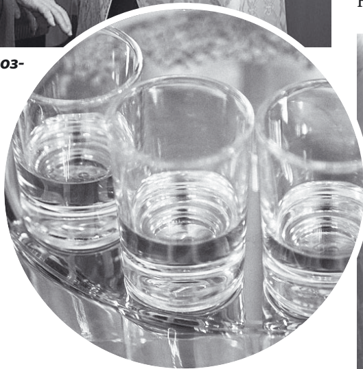
Елей – символ милости Божией, изливаемой на человека.

Тут важно понимать, что в истории Елеосвящения его применение как таинства, дополняющего покаяние здоровых, – вторично. Таким образом, ещё в средние века в литургической практике совершения Елеосвящения возникло два применения этого таинства: первое – в его основном значении как таинства, предназначенного для больных, и второе – в его вторичном значении как таинства, дополнявшего и оканчивавшего покаяние здоровых людей.