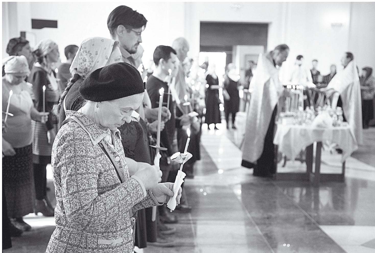
Во времена Соборования верующие держат зажженные свечи, которые символизируют пламенную молитву и устремленность к Богу.

Во-вторых, в каждом Таинстве действие благодати в жизни человека имеет четко определенный, конкретный характер. Участвуя в таинстве, мы приобретаем новые свойства, в нас происходят качественные изменения. Например, в Крещении человек рождается духовно, в Миропомазании ему сообщаются дары Святого Духа, необходимые для духовного развития, в Покаянии – очищается от грехов и меняется внутренне, в Причастии соединяется со Христом. Что же касается обрядов, то в них христианину преподается благодать Божия и благословение на те или иные виды деятельности, но как именно действует эта благодать,