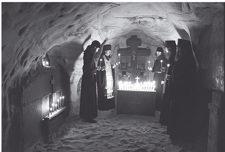
Насельники Псково-Печерского монастыря в пещере.

В монастыре находятся: Богом зданные пещеры (ближние и дальние), церкви: Успенская, Покровская, Сретенская, Михайловская (собор), Благовещенская, Лазаревская, Николы Вратаря, Воскресения Христова (в дальних пещерах), Корнилевская, Псково-Печерских преподобных, а также Звонница, Дом настоятеля, Братский корпус, Святые источники, Ризница, Крепостные стены с башнями.