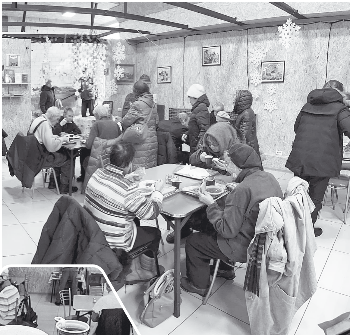
Посетители благотворительной столовой.