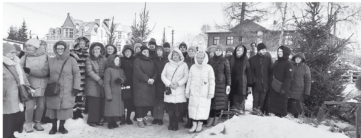
Общее фото группы.

Очень интересной оказалась экскурсия по некрополю Донского монастыря. Здесь похоронено много великих людей: генерал-лейтенант русской армии Антон Иванович Деникин, генерал Каппель, русский писатель Александр Солженицын. Жаль, что из-