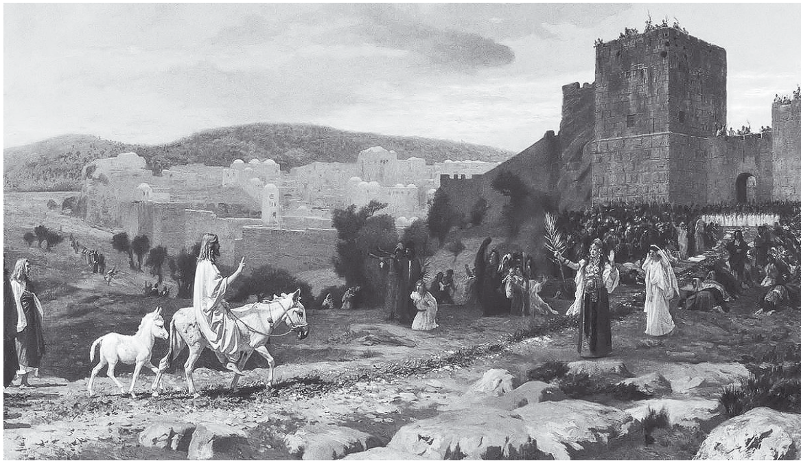
«Въезд Иисуса Христа в Иерусалим». Жан Леон Жером.

и первосвященники, и искали, как бы погубить Его, ибо боялись Его, потому что весь народ удивлялся учению Его» (Мк. 11, 15-18).