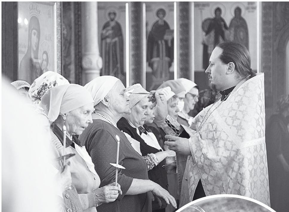
Освященным елеем помазывают лоб, нос, щеки, губы, грудь и руки больного.

го, они вносят соблазн в умы «внешних», не принадлежащих к Церкви, но сочувствующих ей людей.